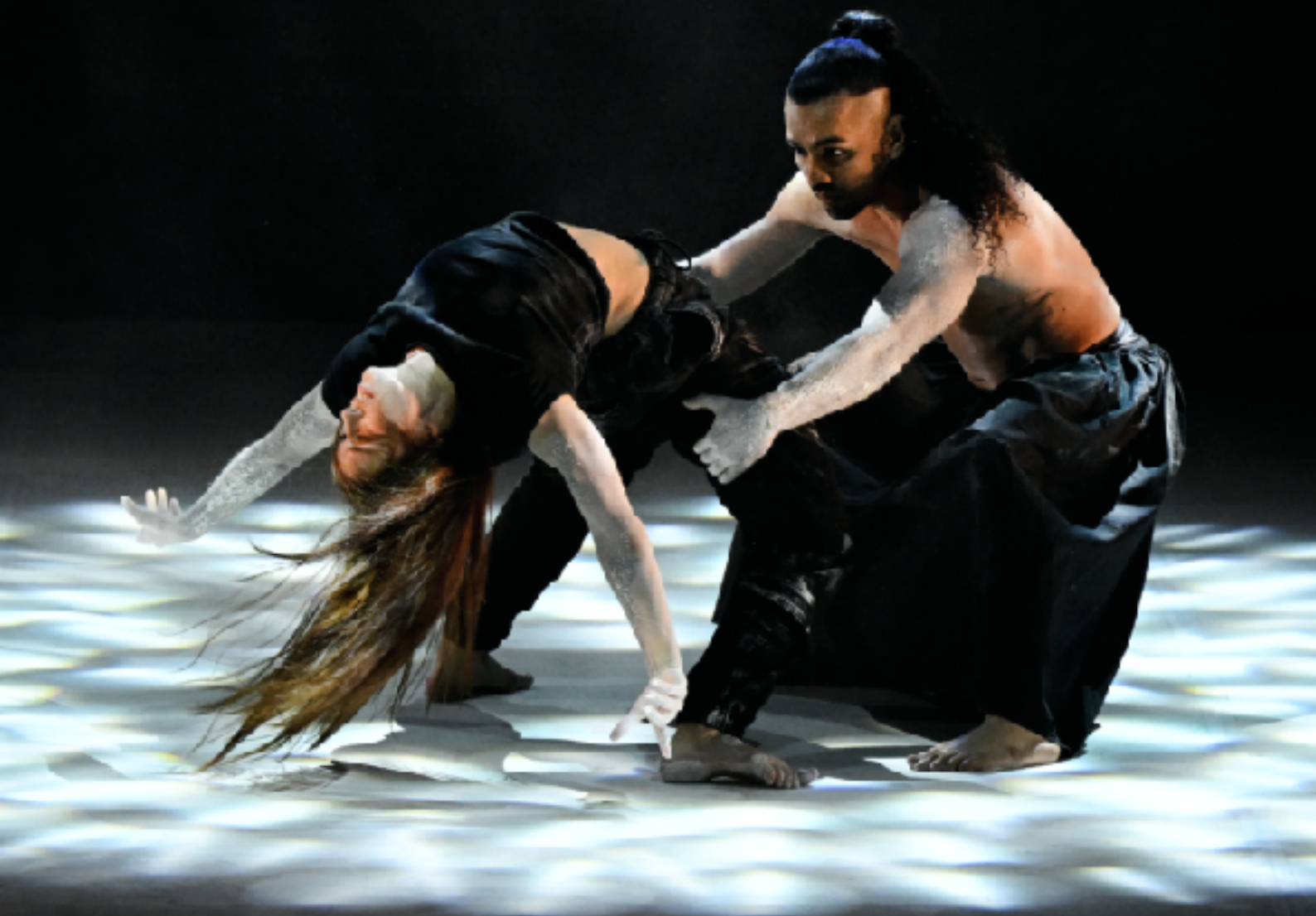
COMPAÑÍA COLOMBIANA DE DANZA CONTEMPORÁNEA DE INCOLBALLET.